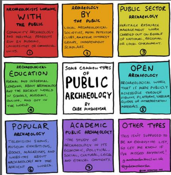
Moshenska, G. (2017), "Key Concepts in Public Archaeology", UCL Press.