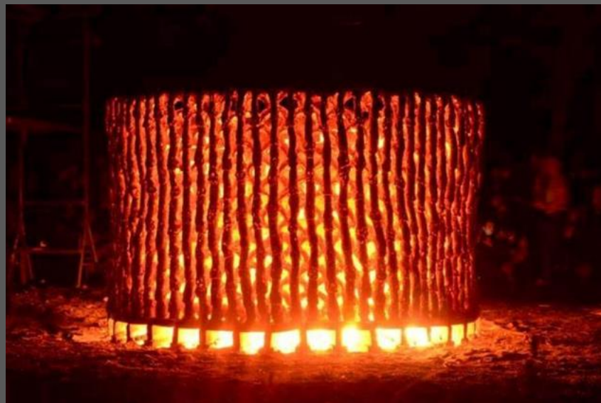
Kunst og Knogler - Alken Enge 2014