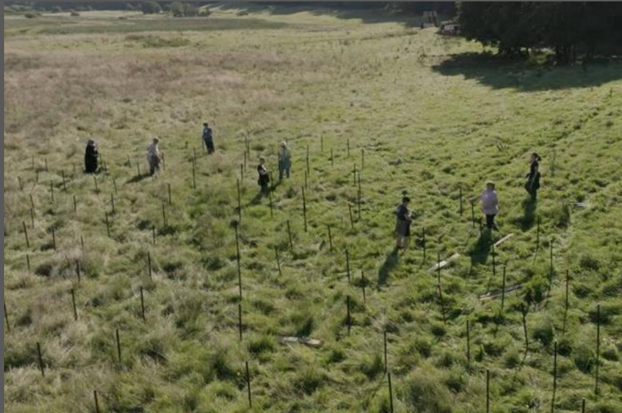
Den hellige dal 2023