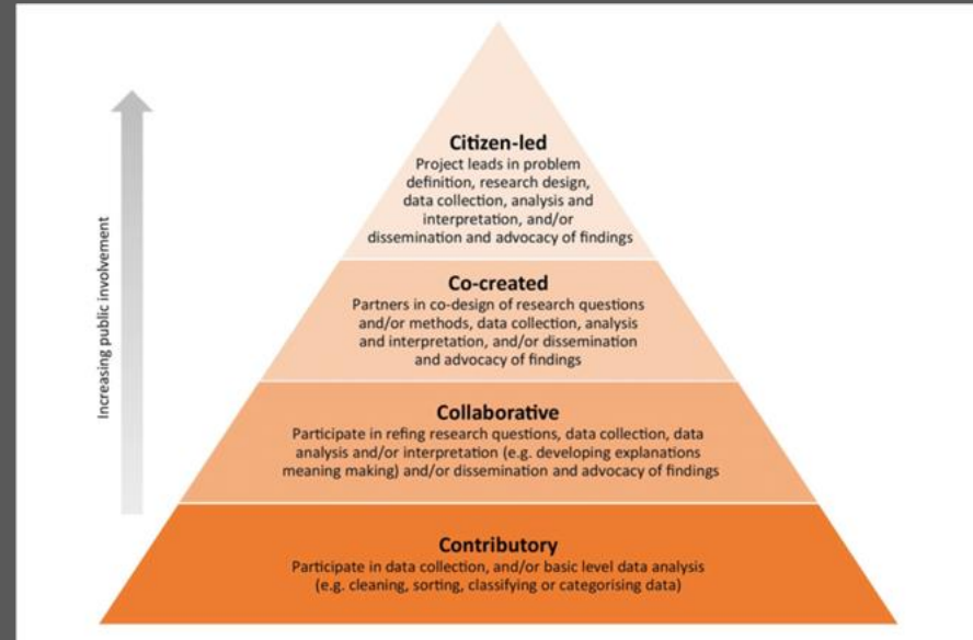
Marks L, Laird Y, Trevena H, Smith BJ, Rowbotham S. A Scoping Review of Citizen Science Approaches in Chronic Disease Prevention. Front Public Health. 2022 May