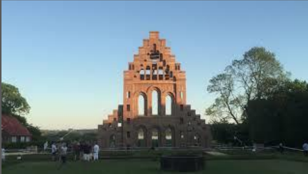
Øm Kloster genopstår 2017